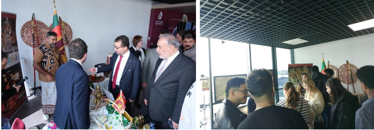
Kültür Günü' etkinliğine katıldı.

Sri Lanka Ankara Büyükelçiliği, 06 Mayıs 2026 tarihinde OSTİM Teknik Üniversitesi tarafından düzenlenen '7'nci Uluslararası